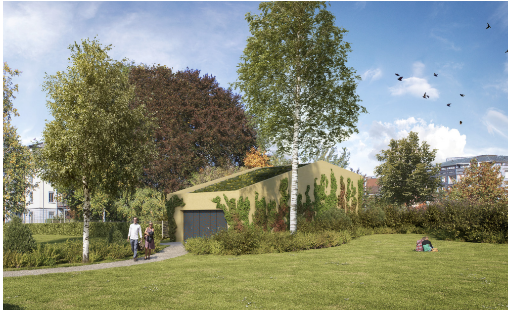
Pumpwerk Schindlergut: Bereich Nordstrasse, Kronenstrasse und Kornhausstrasse